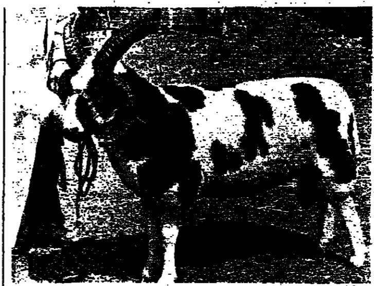
كشش ياريمه قرون نار: هذا الكشش البريطاني صنفه ٧٠٠ مناسي في المعرض الملكي البريطاني لعام ١٩٧٧. ولادة الميرسون ان الكشش القاتل له اربعة قرون.

نسخة نادرة للقرآن الكريم في متحف لاهور حصل متحف لاهور في باكستان على نسخة للقرآن الكريم يرجع تاريخها الى السنة الرابعة للهجرة.